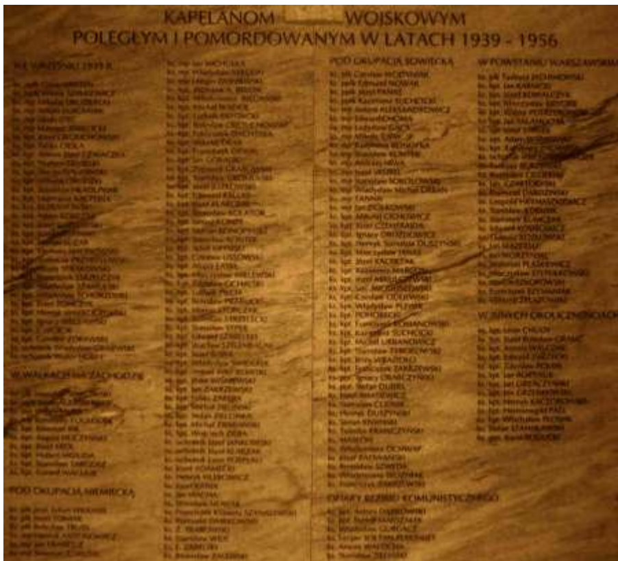
Tablica pamiątkowa, katedra polowa WP, Warszawa