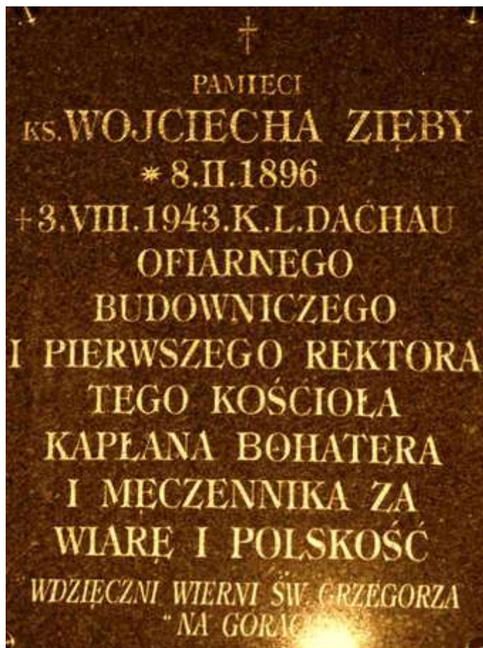
Tablica pamiątkowa, kościół parafialny pw. św. Grzegorza, Gorzejowa