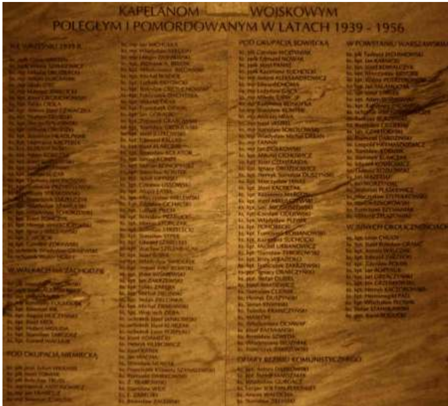
Tablica pamiątkowa, katedra polowa WP, Warszawa