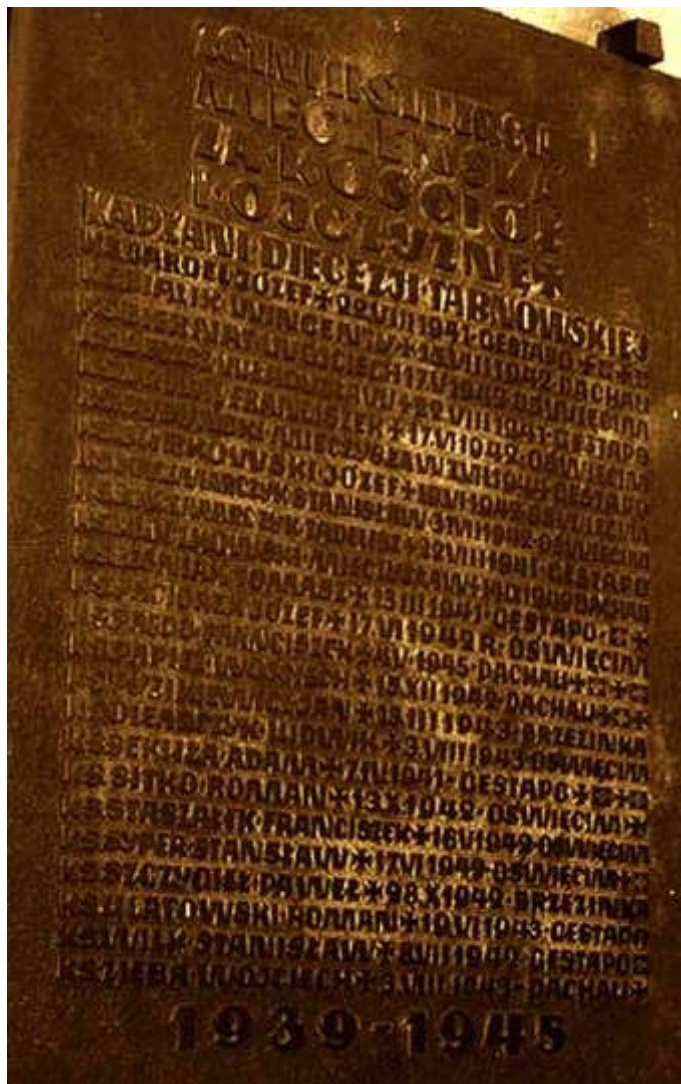
Tablica pamiątkowa, katedra, Tarnów