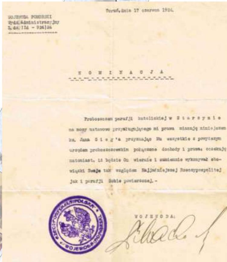
Nominacja na proboszcza, 17.vi.1924 r.