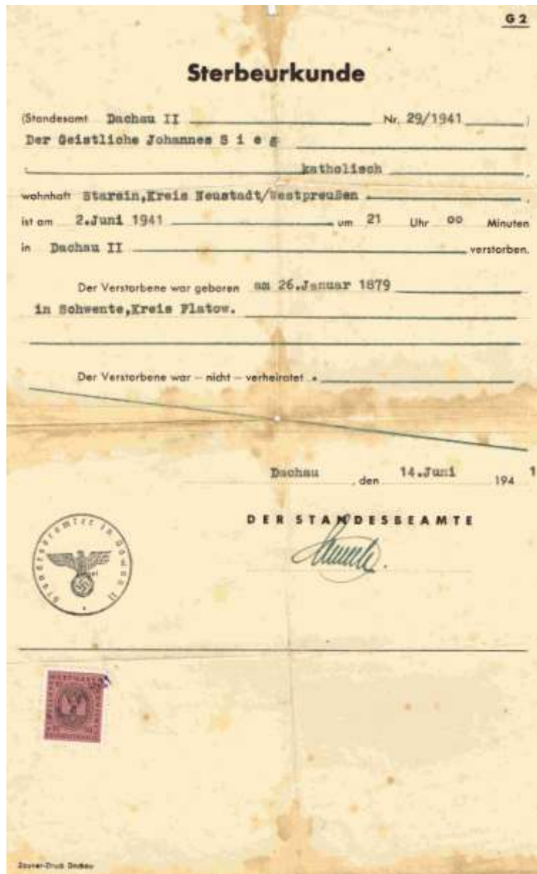
Świadectwo zgonu, Dachau