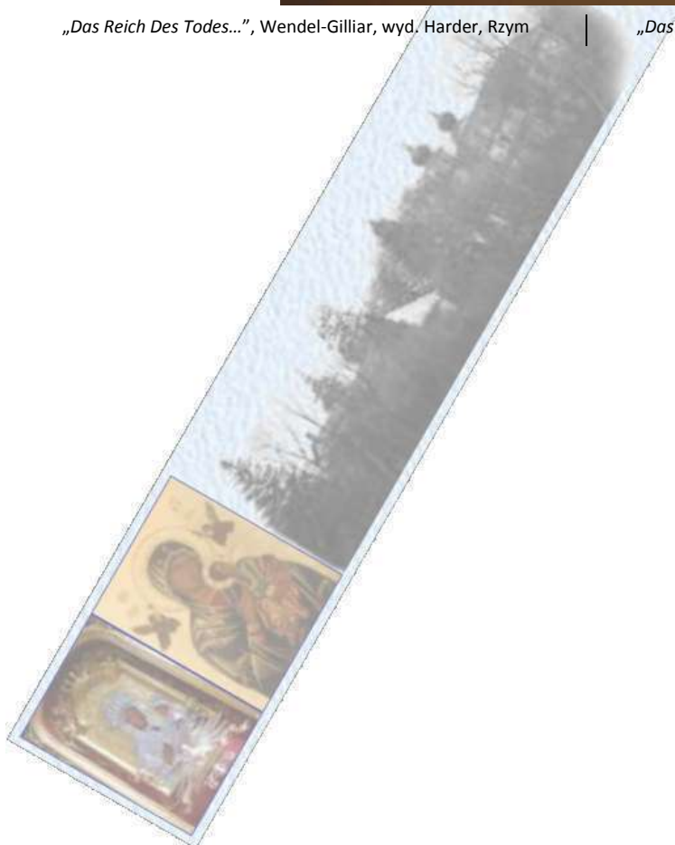
„Das Reich Des Todes...“, Wendel-Gilliar, Harder house, Rome