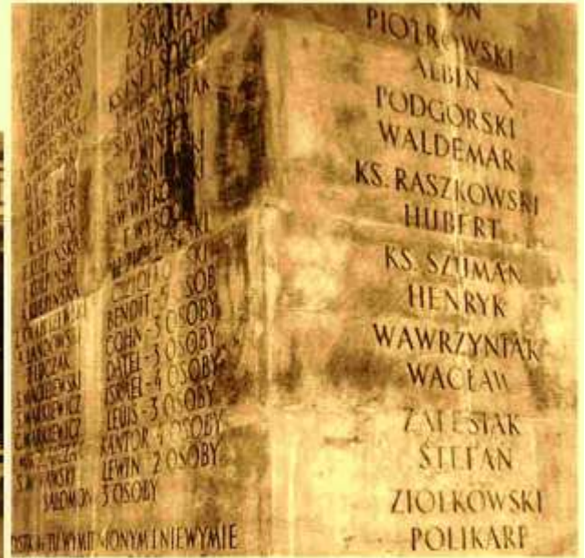
Victims of the II World War monument Town square, Old Fordon