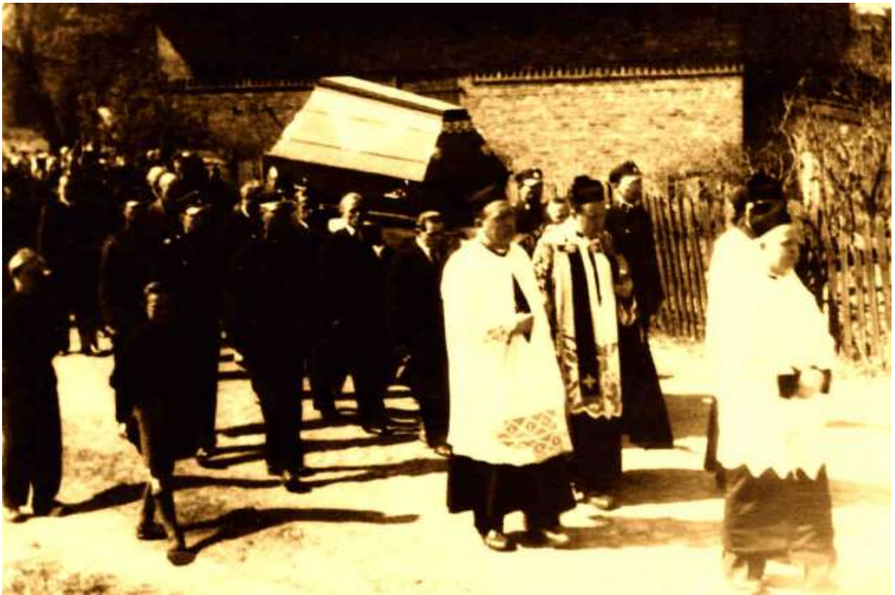
Uroczysty pogrzeb ofiar zbrodni 2 października 1939, 4/5 maja 1947, po ekshumacji