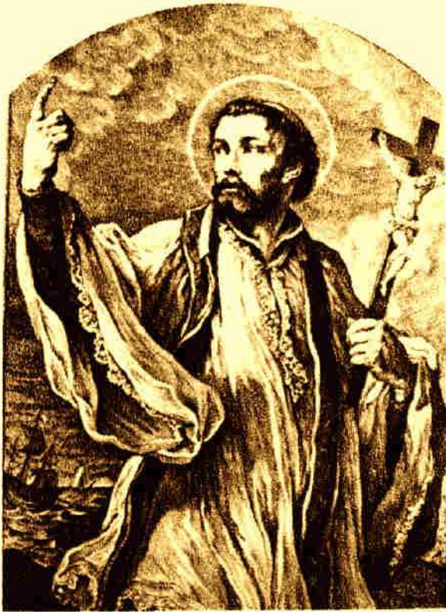
ŚW. FRANCISZEK KSAWERY T. J. Apostoł Indyj