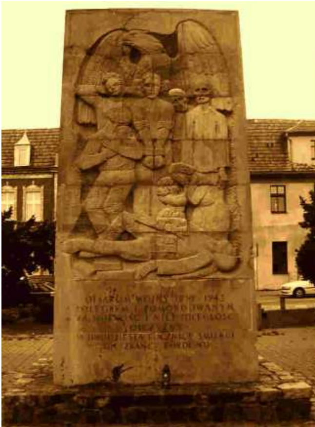
Pomnik ofiar II wojny światowej Rynek, Stary Fordon