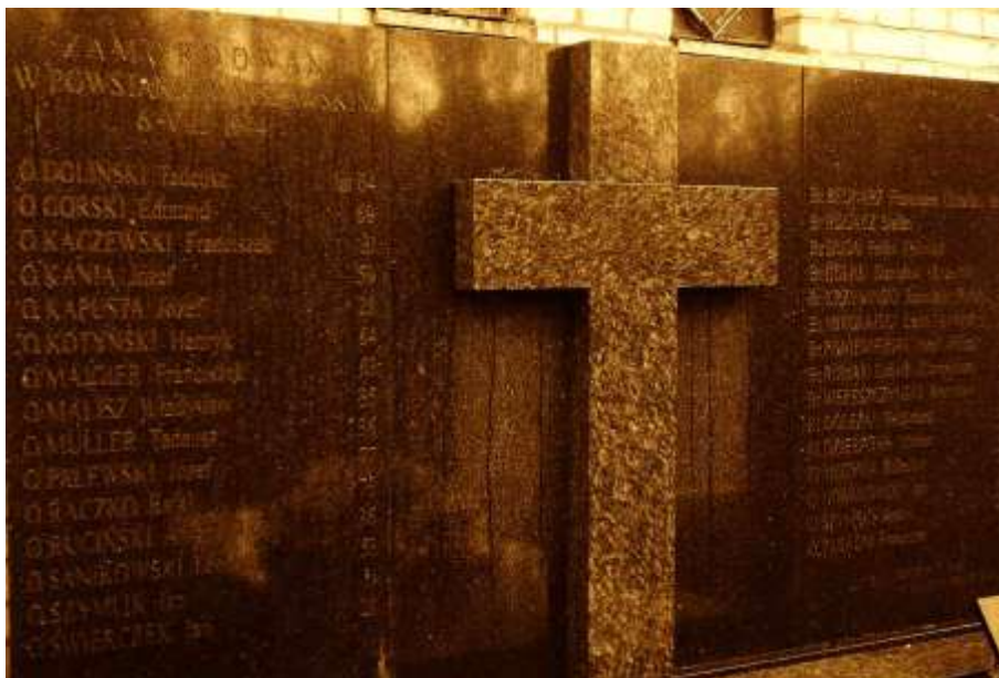
Tablica nagrobna, cmentarz Wolski, Warszawa