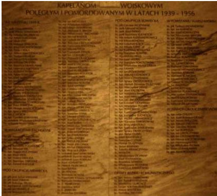
Tablica pamiątkowa, katedra polowa Wojska Polskiego, Warszawa