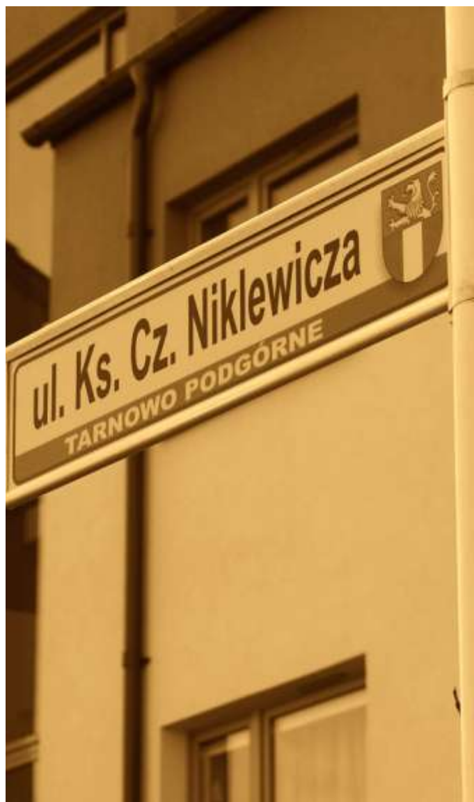
Tabliczka z nazwą ulicy im. Cz. Niklewicza, Tarnowo Podgórne