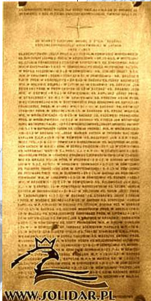
Tablica pamiątkowa bazylika Mariacka, Kraków