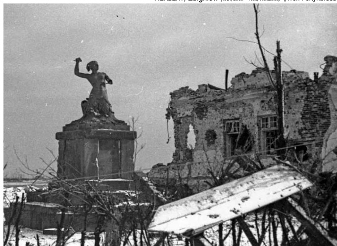
WARSZAWSKA SYRENKA — po powstaniu

HERBERT, Zbigniew (1924, Lwów – 1998, Warszawa) – „Tren Fortynbrasa”