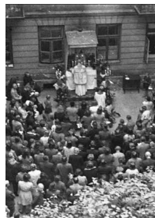
HERBERT, Zbigniew (1924, Lwów - 1998, Warszawa)