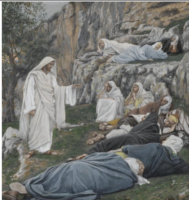
JEZUS NAKAZUJE UCZNIOM ODPOCZAĆ — TISSOT, Jakub Józef, Jacek (1836, Narbonne – 1902, Bulzon)

1886-94, akwarela na graficie na szarym papierze tkanym, 17.9x24.8 cm, Brooklyn Museum, www.brooklynmuseum.org