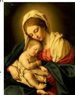
KONOPNICKA Maria (1842.Suwałki – 1910.Lwów)