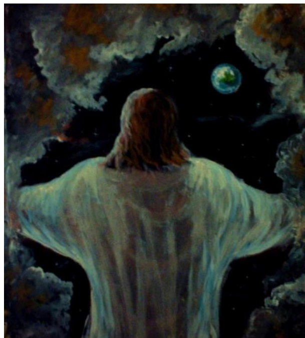
PRZYJDE JAK ZŁODZIEJ W NOCY — FLAKE, Antoni Rajnard (USA) 2012, szkło: flakerajnard.com

Ja chrzcilem was wodą, ON zaś chrzcić was będzie DUCHEM ŚWIĘTYM ».