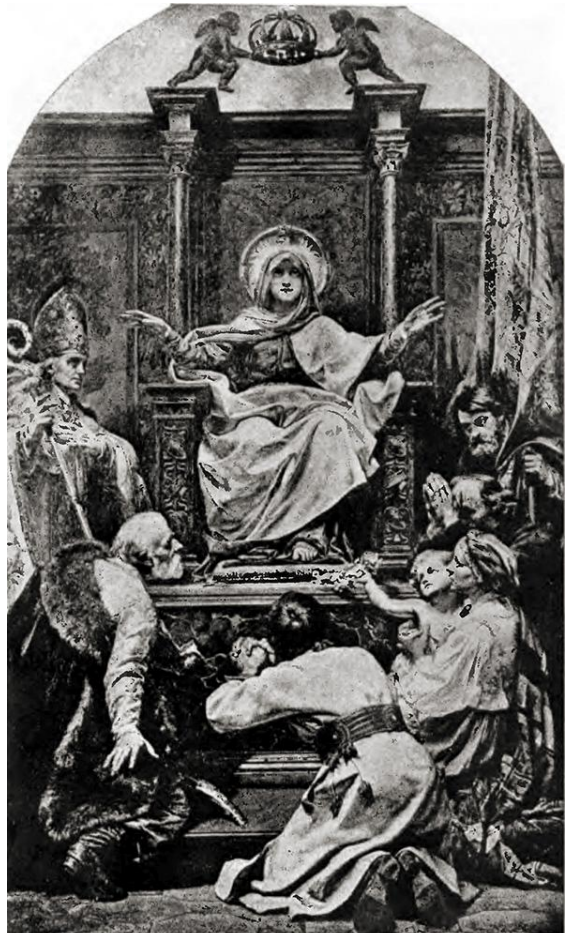
REGINA POLONIAE (MATKA BŁOGOSŁAWIACA) — Stryka, Jan (1858, Luów – 1925, Rzym) 1883, olejny na płótnie, kościół II Gesù, Filadelfia PA, źródło: https://shilohart.com

WĘGRZYN, Kazimierz Józef (ur. 1947, Miejsce Piastowe)