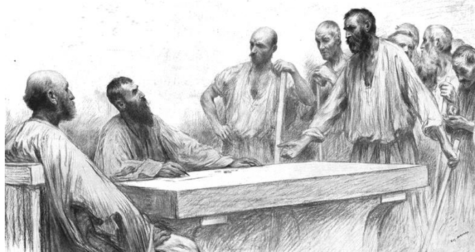
ROBOTNICZY W WINNICY — BURNAND, Karol Ludwik Eugeniusz (1860, Moudon – 1921, Paryż) przedłom XIX/XX w., rysunki, wyd. 1908, Paryż, jako „Les Parables” Parna.