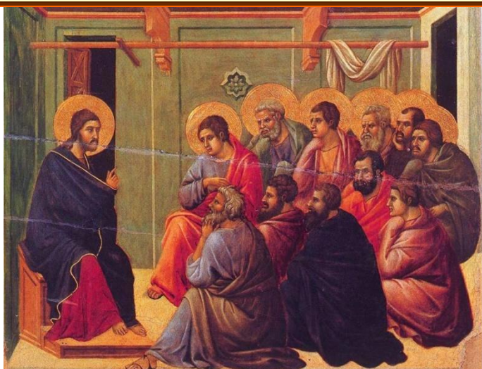
CHRYSZTUS OPUSZCZAJĄCY APOSTOŁÓW — DUCCIO, di Buoninsegna (1259/1260, Siena – 1318/1319, Siena)

1308-1311, tempera na desce, 50×53 cm, Museo dell'Opera Metropolitana del Duomo, Siena.