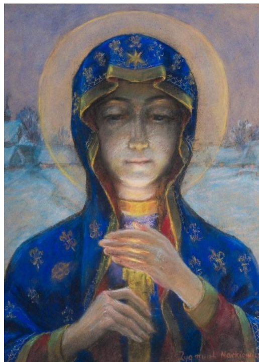
MATKA BOSKA GROMNICZNA — NARKIEWICZ, Zygmunt (1988, Moskwa — 1992, Warszawa) 1926, pastel, papier naklejony na tekturę; 54x41 cm, przedruk

WĘGRZYN, Kazimierz Józef (ur. 1.1.1947, Miejsce Piastowe)