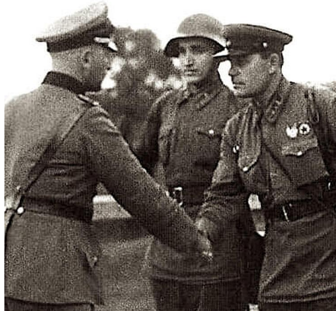
PRZYJACIELSKIE SPOTKANIE) 1939 - po pakcie Ribbentrop-Mołotow. Zdjęcie wyjęte z filmu