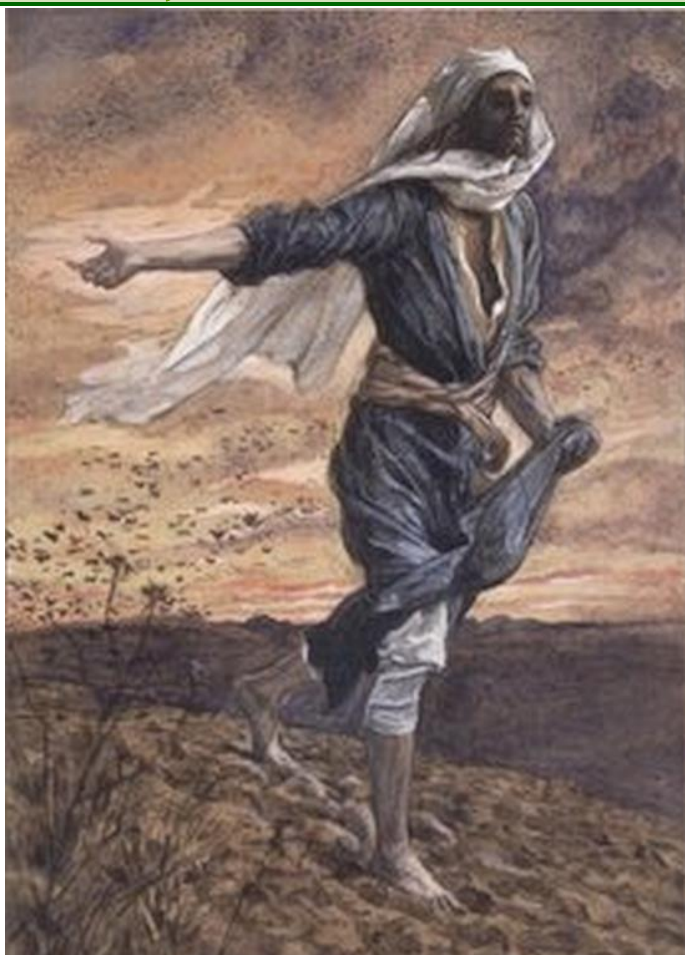
SIEWCA – TISSOT, Jakub Józef Jacek (1836; Nantes – 1902; Bulhry)

1886-94, farby wodne na szarym papierze, 24,8×13,7 cm, Brooklyn Museum, www.brooklynmuseum.org