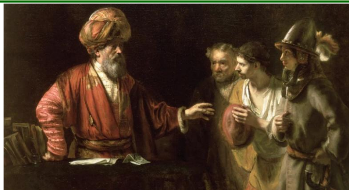
NIEWDZIĘCZNY SŁUGA — DROST, Wilhelm (1633, Amsterdam – 1659, Wenecja) c. 1655, olejny na płótnie, 53.3×64.8 cm, kolekcja Wallace, Londyn