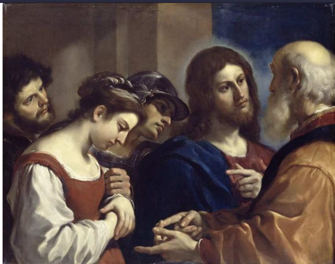
CHRYSTUS I KOBIETA POCHWYCONA NA CUDZOŁÓSTWIE — BARBIERI, Jan Franciszek (GUERCINO) (1591, Cento – 1666, Bolonia) ok. 1621, olejny na płótnie, 98.2×122.7 cm, Dulwich Picture Gallery, Londyn, zob. commons.wikimedia.org